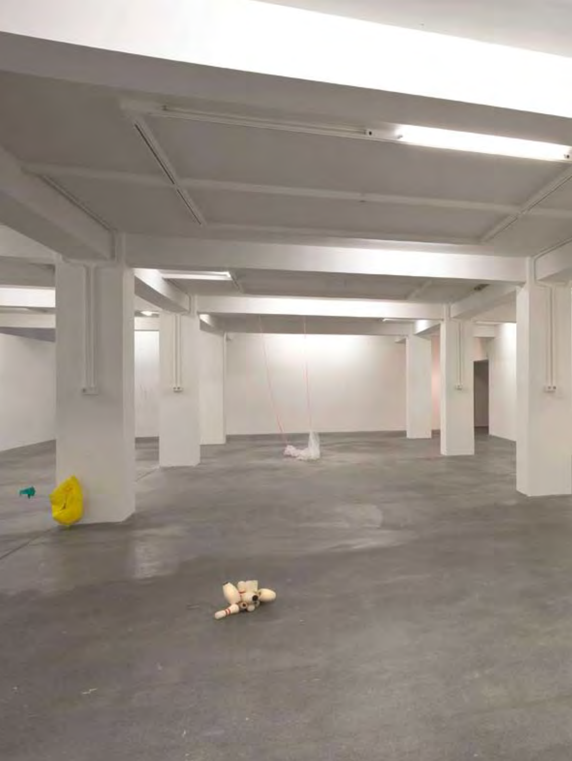
Touching the membrane , rubber, strings, foam, fly-line, plastic, sticks and cloth. The Reykjavik Art Museum, 2007.