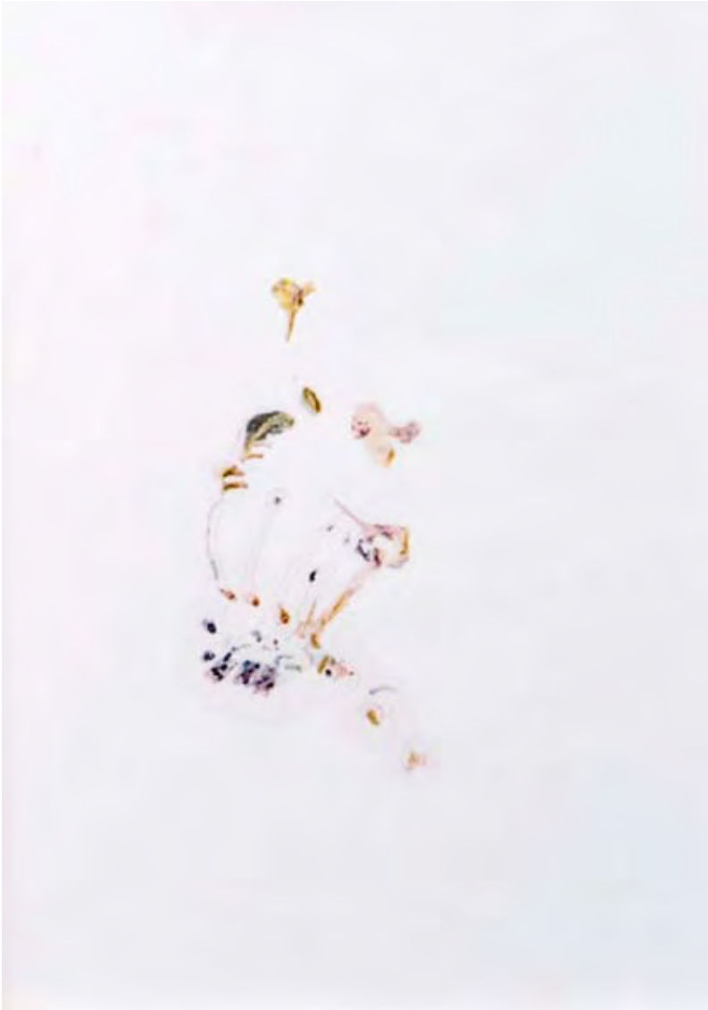
Water-colours, pencil and olive-oil, 2007, 29 x 42 cm