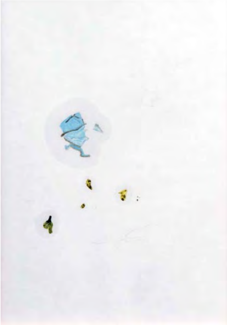
Water-colours, pencil and olive-oil, 2007, 29 x 42 cm