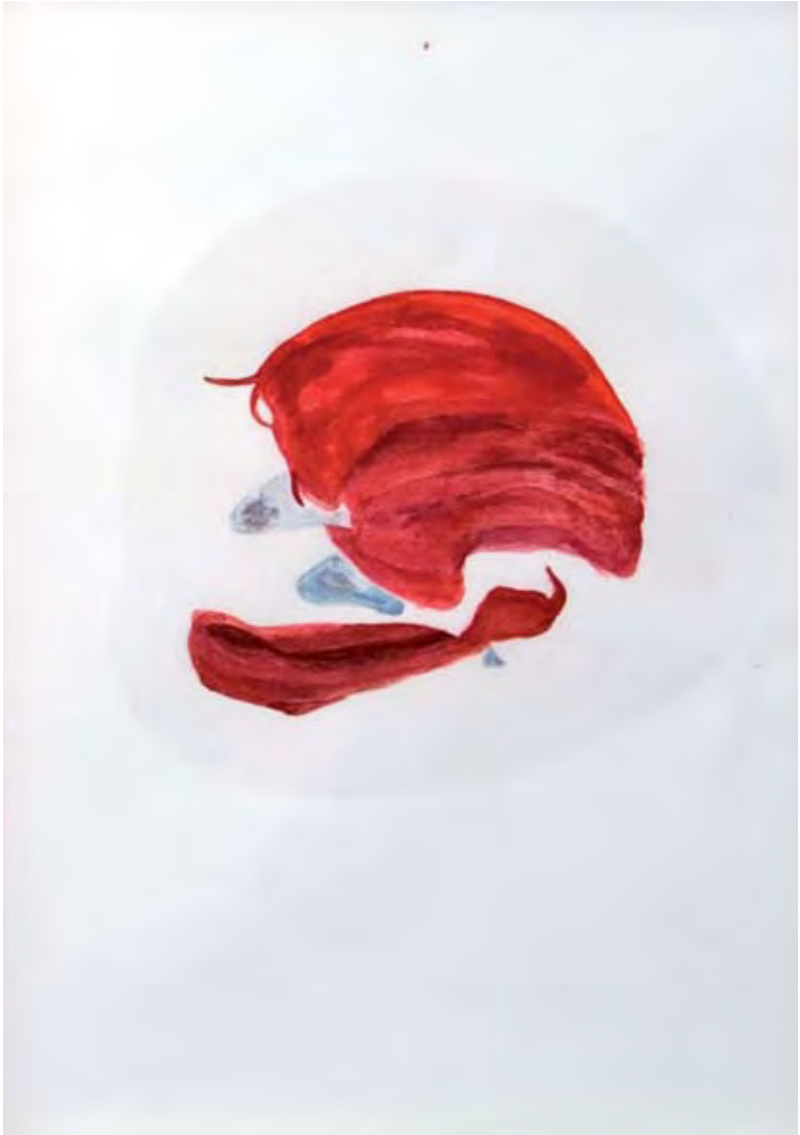
Water-colours, pencil and olive-oil, 2007, 29 x 42 cm