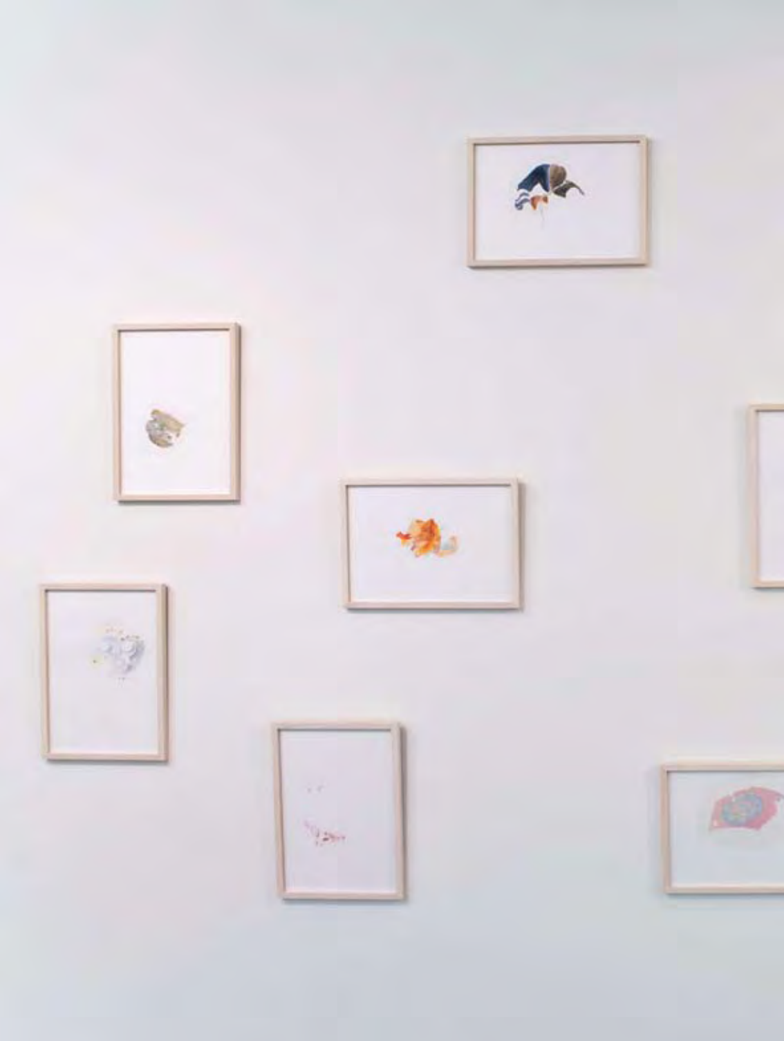
Water-colours, pencil and olive-oil, 2007, 29 x 42 cm